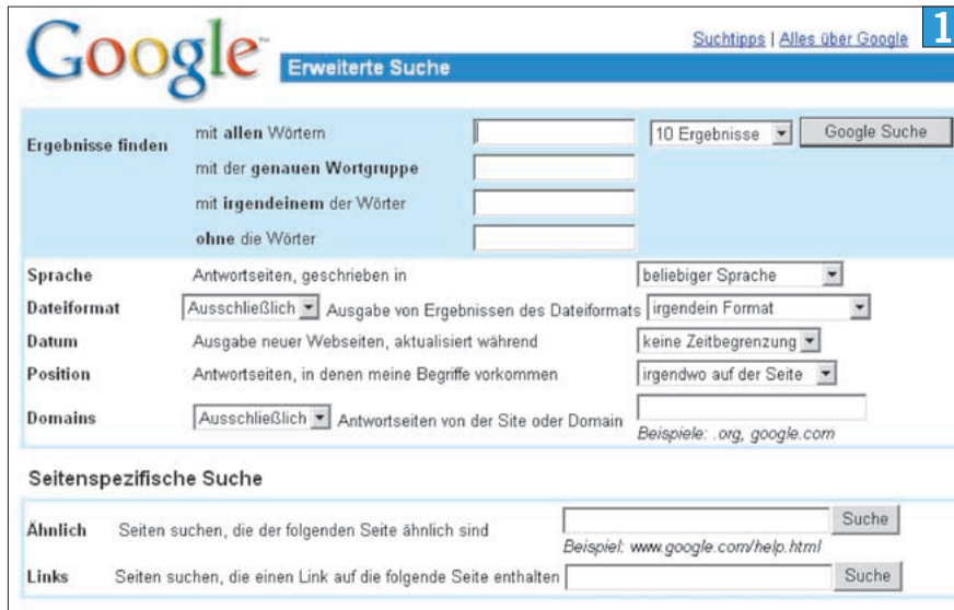
1 Die «Erweiterte Suche» von Google bietet zahlreiche Möglichkeiten, gezielt zu Treffern zu kommen

Die Suchmaschine Google ist beliebt – fast zu beliebt. Wegen des zunehmenden Missbrauchs wird es immer schwieriger, sich zurechtzufinden. Zum Glück gibts die «Erweiterte Suche».